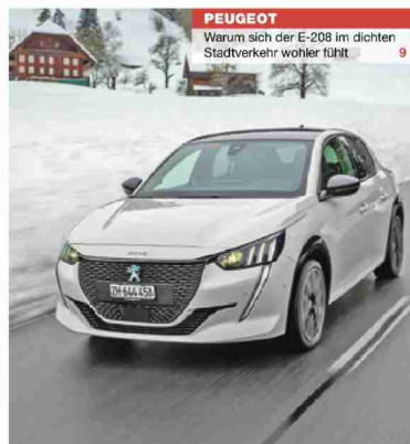
PEUGEOT Warum sich der E-208 im dichten Stadtverkehr wohler fühlt 9