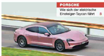
PORSCHE Wie sich der elektrische Einstiegs-Taycan fährt 8