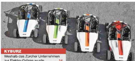
KYBURZ Weshalb das Zürcher Unternehmen zur Elektro-Grösse wurde 14